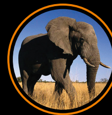
AFRYKAŃSKA PRZYGODA 3D