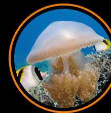
POD TAFLĄ OCEANU 3D