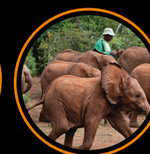
DZIKIE Z NATURY 3D